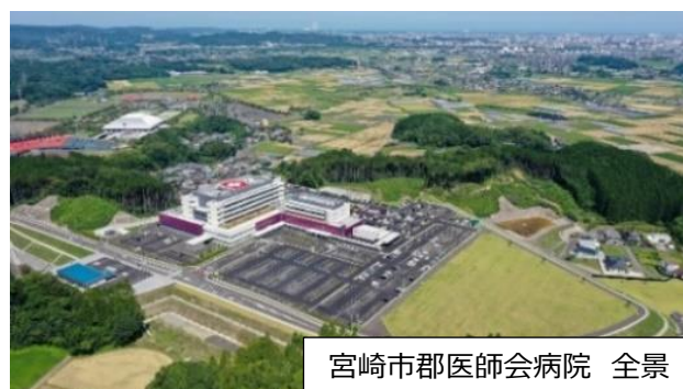
宮崎市郡医師会病院 全景

〔発行〕公益社団法人 宮崎市郡医師会 地域包括ケア推進センター（医師会病院棟 1階）